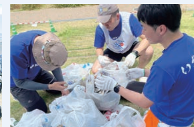
分別も各チームで実施