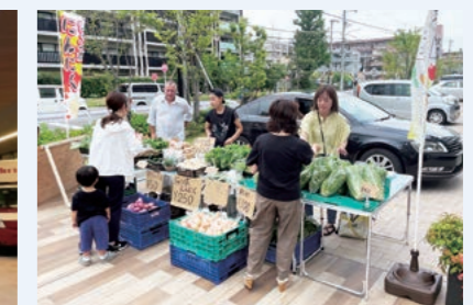
新鮮な野菜の販売も