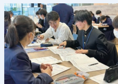
市西:兵庫「咲いテク」事業の一つ「五国SSH連携プログラム」でのディスカッション(本社SOUTH WING)

知識を活かした助言を行っています。東校では、数理・科学コースの1年生を対象に、「探究の時間」で、当社社員による「研究テーマ設定の考え方」の講演および気象分野への助言を通し、生徒の探究心向上に協力しています。