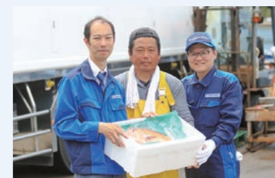
ご協力いただいた養殖業者さんと当社社員

全国の漁港に拠点をもち、漁業関係者と深いつながりを持っているFURUNOは、こども食堂への支援を開始しました。「水産業に携わる皆さんと子どもたち、両方を笑顔に」をモットーに、人と人をつなぐ活動を推進しています。子どもたちにお魚をもっと好きになってもらうことで、漁師～地域～家族の絆を活性化する活動を目指しています。