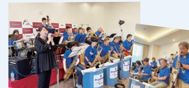
阪急西宮ガーデンズでの演奏会

社員で構成された当社軽音楽部は、企業クラブとして1968年に創部し、活動休止を経て2000年からビッグバンドスタイルに変更して活動を再開しました。“音楽を通して地域に貢献すること”を目標に掲げ、阪急西宮ガーデンズなどの商業施設での演奏会や、「みやっこSWING DAY」など地元西宮で開催されるイベントの実行委員会としての活動など、地域の皆さまから愛される活動を続けていきます。