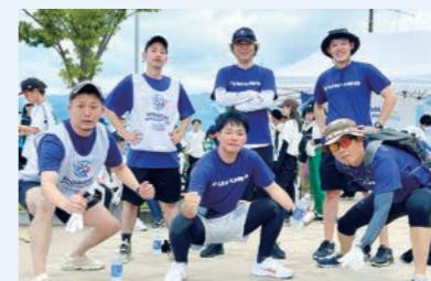
当社から出場した2チーム