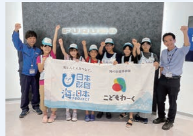
子どもたちと講師役の社員

もたちに実際に海に関わる仕事を体験してもらうことでより学びを深めます。2年目となる2023年度は最新の魚体重推定システムで魚の重さを計測し、AIの基本原則を学びながら養殖漁業の課題解決にチャレンジしました。