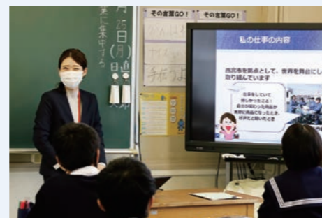
芦屋市立精道中学校での出前授業

本プログラムは、理系出身の女性が仕事を選んだきっかけや現在の仕事内容、やりがいなどを伝えることで理系の職業への興味・関心を高め、将来の自身のキャリアプランを考えるきっかけになることを目的に取り組んでいます。