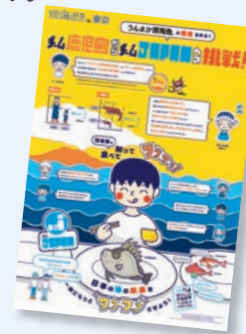
古野電気賞 インフォグラフィックポスター