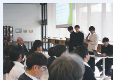
東校:探究活動発表会(本社SOUTH WING)