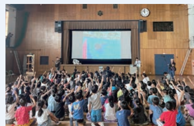
西宮市の小学校での環境学習イベント (西宮市立瓦木小学校)