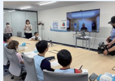
漁業者さんへのオンライン取材