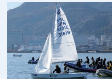
全日本学生ヨット選手権大会

盛り上げ、この貴重な場が継続できるようにサポートすることも当社の使命と考えています。