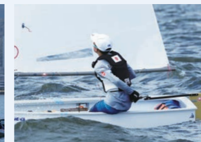
兵庫ジュニアオープン選手権