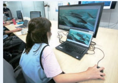
最新のシステムを使用して魚のサイズを計測