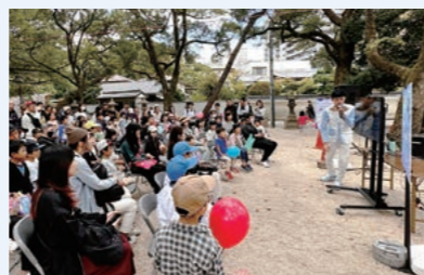
西宮神社での地域向けイベント