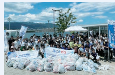
約100名の参加者と西宮浜一帯を清掃

が当社を取り巻く地域の方々と一緒に海の問題に前向きに取り組んでいきたいとも考えています。身近なことからコツコツと、継続的に、私たちの大好きな海を守る活動を行っています。