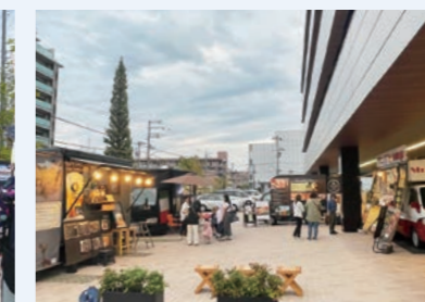
キッチンカー出店時の様子(本社SOUTH WING前)