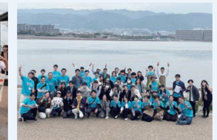
主催の阪神園芸をはじめ、総勢約50人の運営の皆さんと