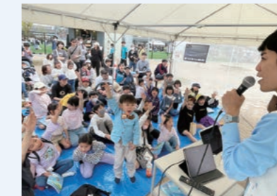
難しい問題にも元気に答える子どもたち

わるさまざまなイベントを開催。当社は海の魅力を伝えるトークショーなどを行い会場を盛り上げました。西宮阪急や無印良品など近隣の企業と連携し、地域と密着した活動を推進しています。