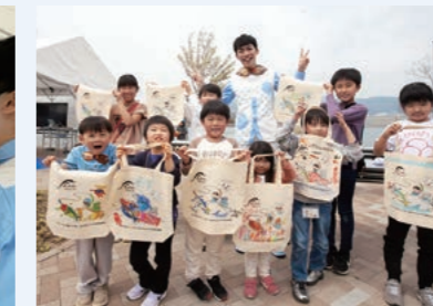
最後はみんなで集合写真。世界に一つだけのオリジナルエコバッグを作りました