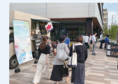
キッチンカーを目当てに自然と人が集まります

だけでなく地域の方々にもご利用いただいています。列に並んでお話ししたり、一緒にランチを楽しんだり。一人でも多くの方の“交流のきっかけ”になることを目指しています。