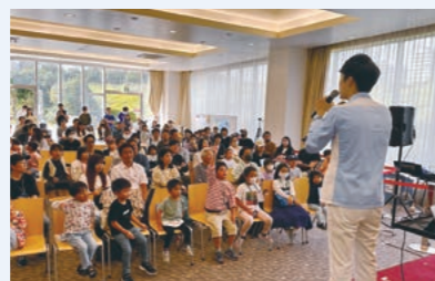
阪急西宮ガーデンズ15周年イベント