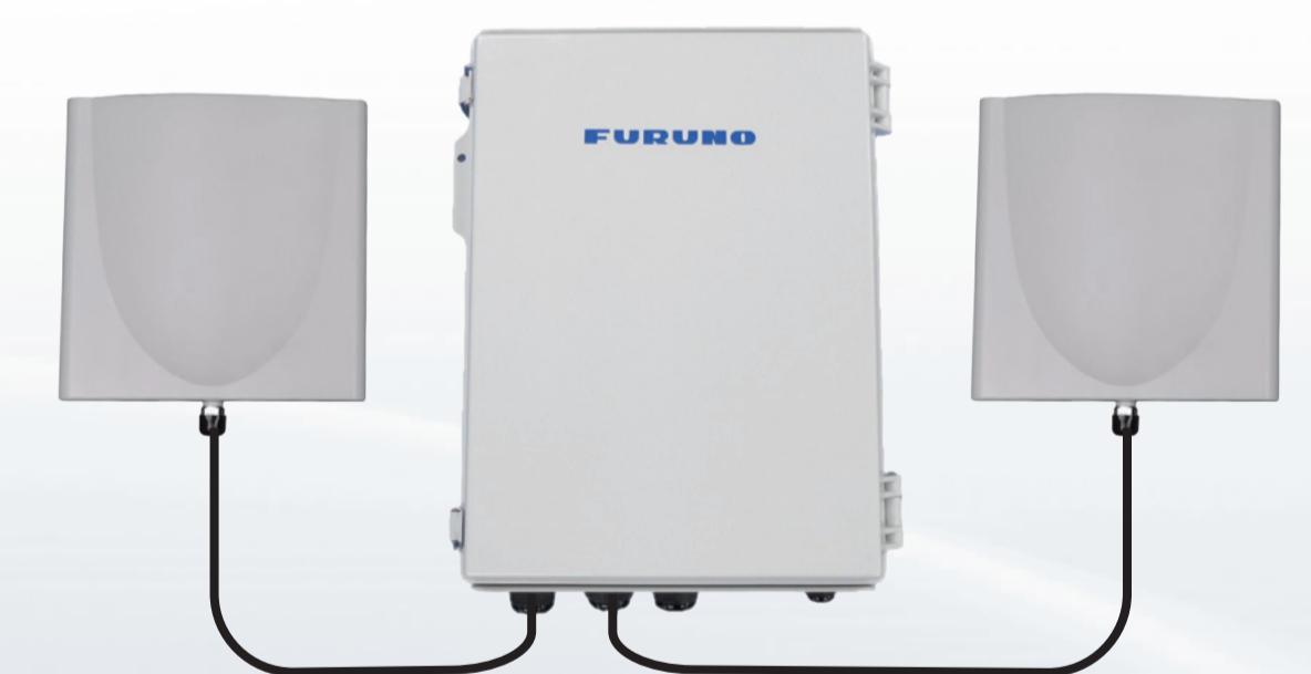
屋外用指向性アクセスポイント (WGL-603)